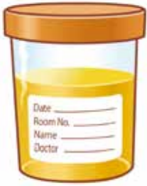
Saami kaadi (kaadi)